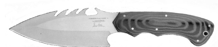
Beispiel 16 Dolch, spitz zulaufende, asymmetrische Klinge und Rücken mit Zacken