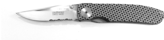
Beispiel 12 einhändig manuell mit Noppe zu öffnendes Klappmesser Klötzli

Dazu gehören Messer, die über einen einhändig bedienbaren Mechanismus manuell einsatzbereit gemacht werden können (z.B. mit einer Noppe oder Vertiefung in der Klinge). Alle diese Messer dürfen nicht getragen werden, gleichgültig wie lang ihre Klinge ist. Für den Erwerb, die Vermittlung und die Ein-, Aus- und Durchfuhr braucht es keine Bewilligung. Nicht darunter fallen die in A/1 beschriebenen Miniaturen.