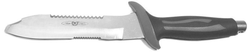
Beispiel 5 Tauchdolch mit asymmetrischer, nicht spitz zulaufender Klinge unter 30 cm