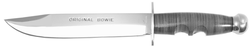
Beispiel 6 Bowie-Messer mit Klinge unter 30 cm, spitz zulaufender asymmetrischer Klinge, aber ohne Rücken mit Säge, Haken oder Zacken (Rücken hat nur eine falsche Schneide)