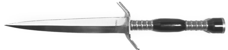
Beispiel 11 Stiletto, symmetrische, spitz zulaufende Klinge unter 30 cm