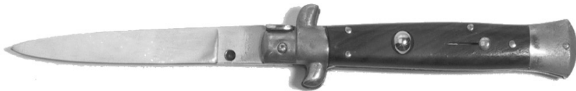
Beispiel 8 Springmesser

Ausgenommen sind die unter A/1 erwähnten Miniaturen. Ebenfalls fallen nicht unter dieses Verbot Messer, die über einen einhändig bedienbaren Mechanismus manuell einsatzbereit gemacht werden können (z.B. mit einer Noppe oder Vertiefung in der Klinge). Diese Messer fallen unter C/1 und werden dort dargestellt.