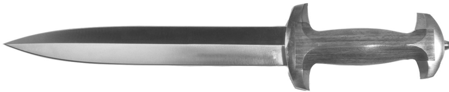
Beispiel 3 Dolch mit symmetrischer, spitz zulaufender Klinge von über 30 cm

Bei den asymmetrischen Dolchen ist das Begriffsmerkmal der “falschen Schneide” weggefallen. Dolche mit asymmetrischer Klinge gelten nur noch dann als Waffen, wenn der Rücken eine Säge, einen Haken oder einen Zacken aufweist. Dolche mit asymmetrischer Klinge und einem Rücken ohne Säge, Haken oder Zacken fallen demgemäss nicht mehr unter das Waffengesetz.