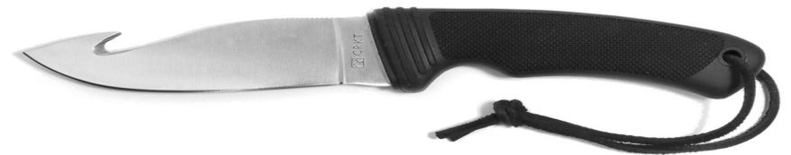
Beispiel 15 Dolch, spitz zulaufende, asymmetrische Klinge und Rücken mit Haken