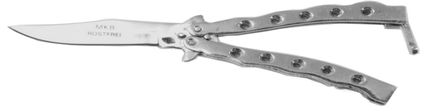
Beispiel 9 Schmetterlingsmesser